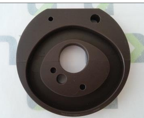
Excêntrico do Redutor de Ruídos para Tajima e ZGM ST-0738K