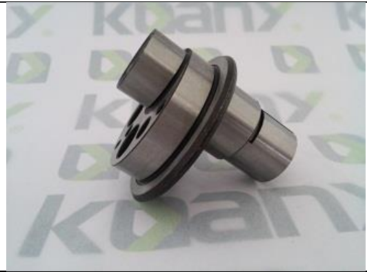
Excêntrico de Aço – Perfurado com Eixo Curto ST-0306