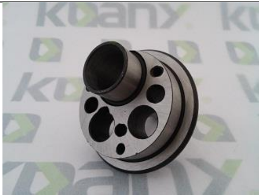
Excêntrico de Aço – Perfurado com Eixo Curto ST-0306