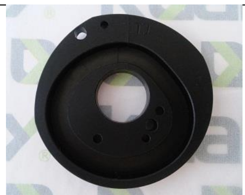
Excêntrico Bi-partido Tajima ST-0255