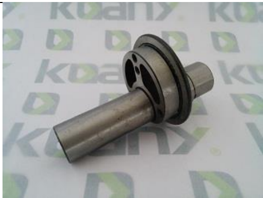
Excêntrico de Aço com Eixo Longo High Speed ST-0306A