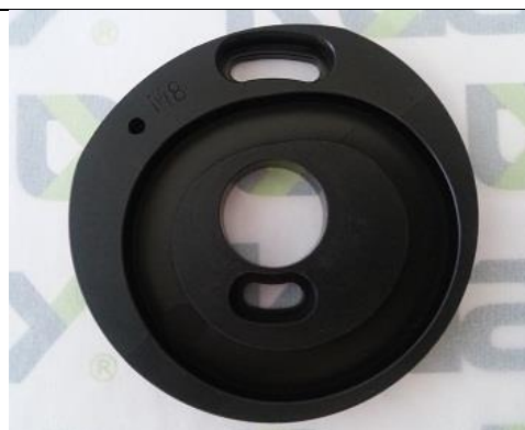
Excêntrico do Estica-Fio Bi-partido M8 ST-0202