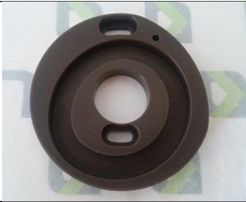
Excêntrico Bi-Partido do Estica-Fio – Eixo Grosso ST-0257B