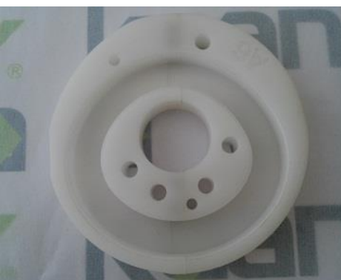
Excêntrico Bi-partido A6 ST-4810