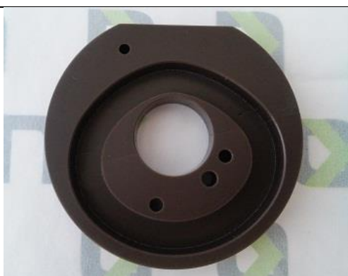
Excêntrico do Redutor de Ruídos – Eixo Grosso ST-0205B