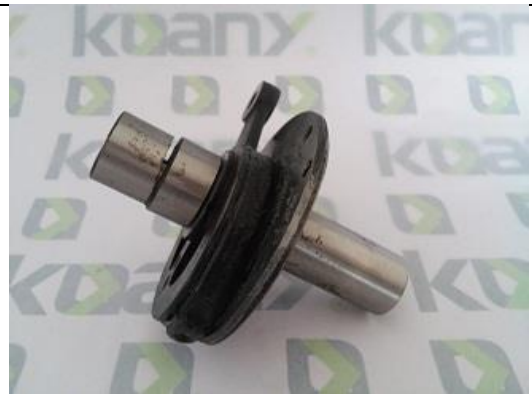
Excêntrico de Aço Completo - Eixo Longo ST-0305