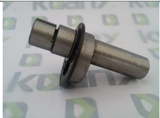
Excêntrico de Aço com Eixo Longo High Speed ST-0306A