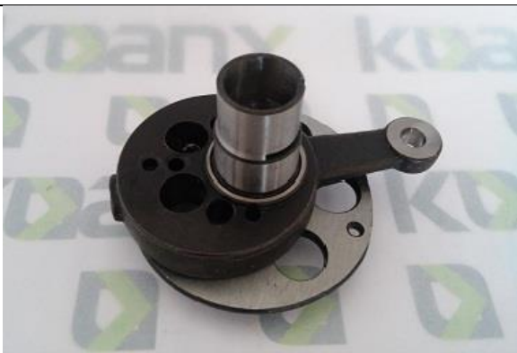
Excêntrico de Aço Completo – Eixo Curto ST-0304A