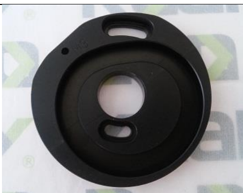
Excêntrico Bi-partido M3 ST-0203