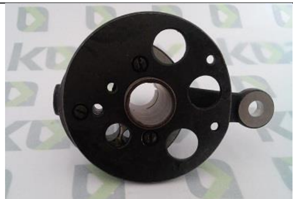
Excêntrico de Aço Completo – Eixo Curto ST-0304A