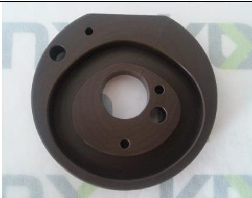
Excêntrico Bi-partido do Redutor de Ruídos Koany ST-0205